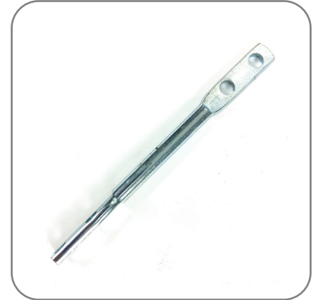
3. ตัวยึดกระจก