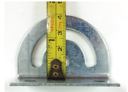
ตัวยึดผนัง สูง 4 \pm 0.2 cm.