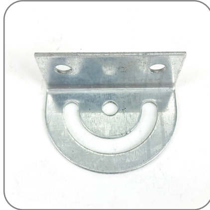
2. ตัวยึดผนัง