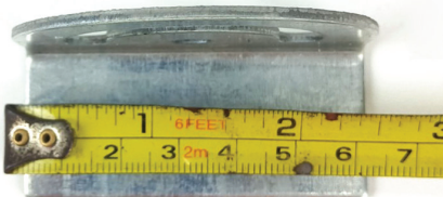
ตัวยึดผนัง ยาว 6.1 \pm 0.2 cm.