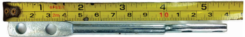
ตัวยึดกระจก ยาว 13.7 \pm 0.2 cm.