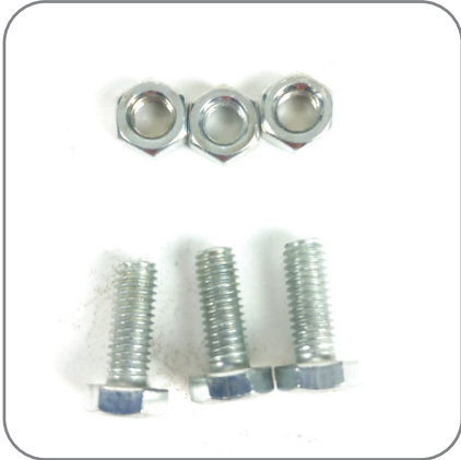
1. น็อต 6 เหลี่ยม